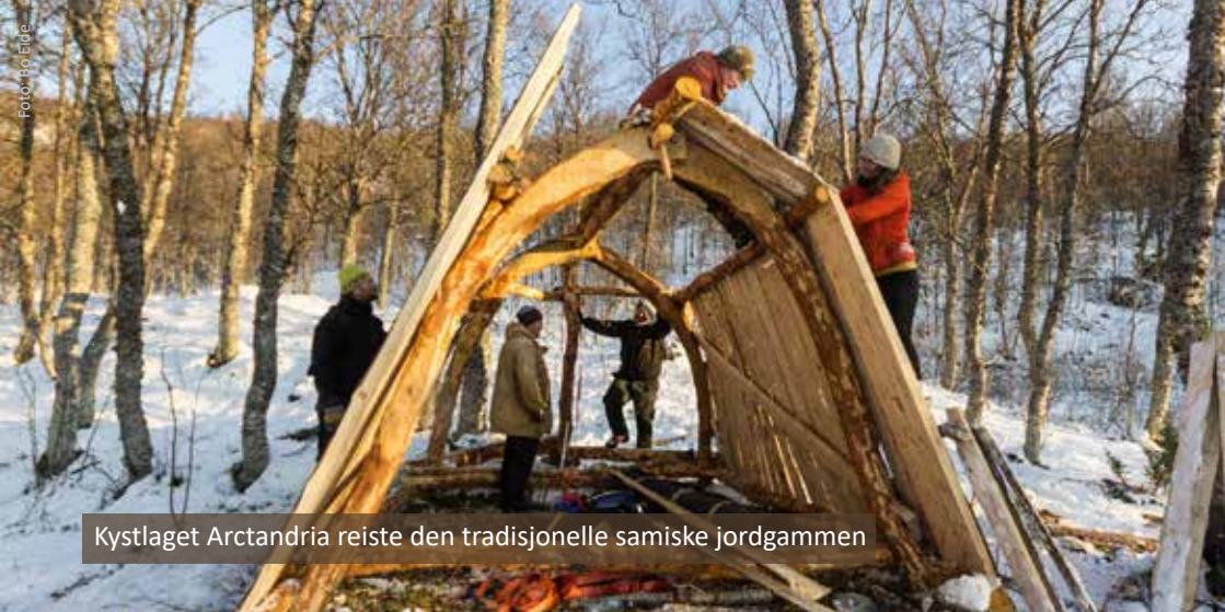
Kystlaget Arctandria reiste den tradisjonelle samiske jordgammen