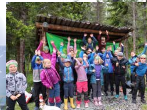
Friluftsskole i Lyngen i sommerferien

I tillegg til disse temaene lærer vi å lage bål, lager mat på bål, spikker, klyver ved, fisker, padler og mye anna lek og moro.