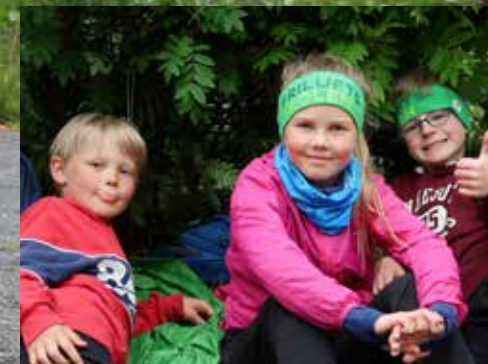
Friluftsskole i Storfjord i sommerferien