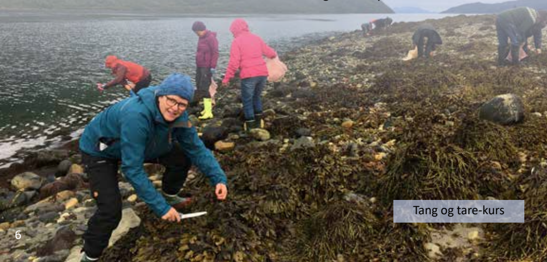
Tang og tare-kurs