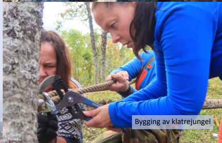
Bygging av klatrejungel