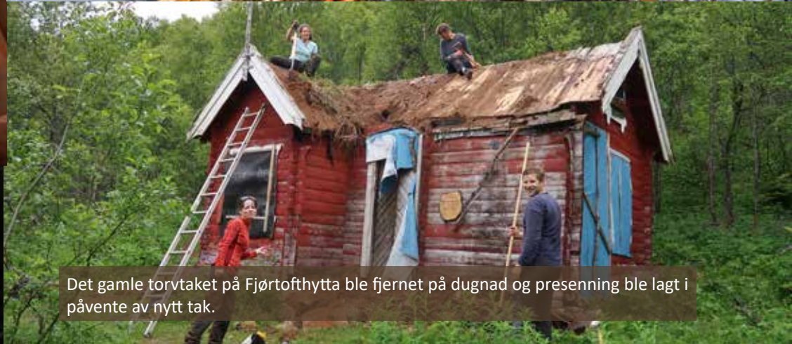
Det gamle torvtaket på Fjørtofthytta ble fjernet på dugnad og presenning ble lagt i påvente av nytt tak.