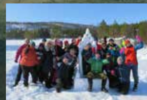
Lærere på snøformingskurs, Læring i friluft