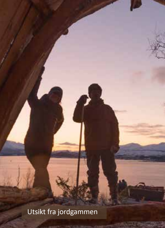
Utsikt fra jordgammen