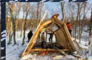
Tradisjonell jordgamme langs kulturlandskapsstien