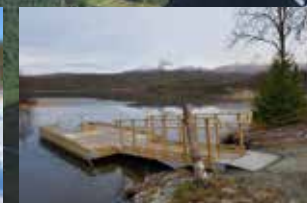
Fylkets første kanobrygge tilpasset rullestol