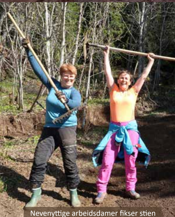
Nevenyttige arbeidsdamer fikser stien