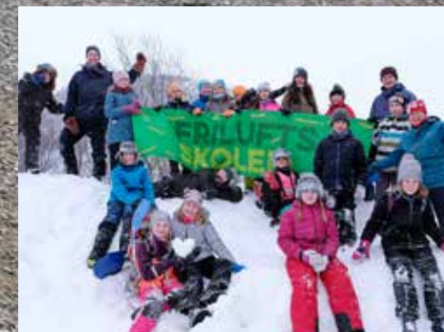
Friluftsskole i Tromsø i vinterferien