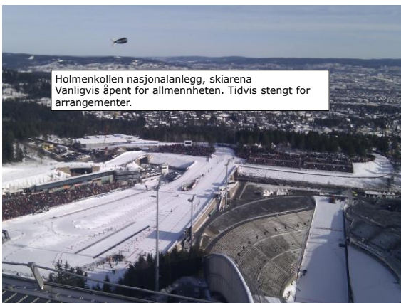
Holmenkollen nasjonalanlegg, skiarena Vanligvis åpent for allmennheten. Tidvis stengt for arrangementer.