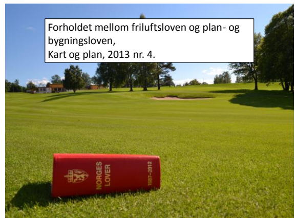
Forholdet mellom friluftsloven og plan- og bygningsloven, Kart og plan, 2013 nr. 4.