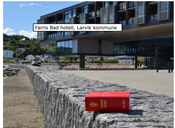
Farris Bad hotell, Larvik kommune

Unntak fra allemannsretten: Friluftsloven § 15 ferdelsesregler Friluftsloven § 16 sperring Politivedtekter Verneforskrifter