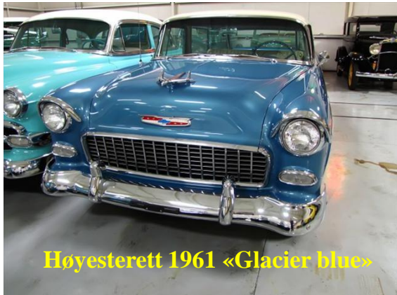
Høyesterett 1961 «Glacier blue»

Adgangen til å pålegge plikter (stille vilkår) av hensyn til friluftslivet i vedtak etter plan- og bygningsloven